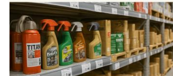
Revisión de stock visible y en trastienda