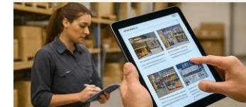
Informes visuales en tiempo real