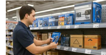
Colocación de materiales en el punto de venta

Un recurso flexible, escalable y 100% operativo, con tarifa media por visita ajustada a volumen.